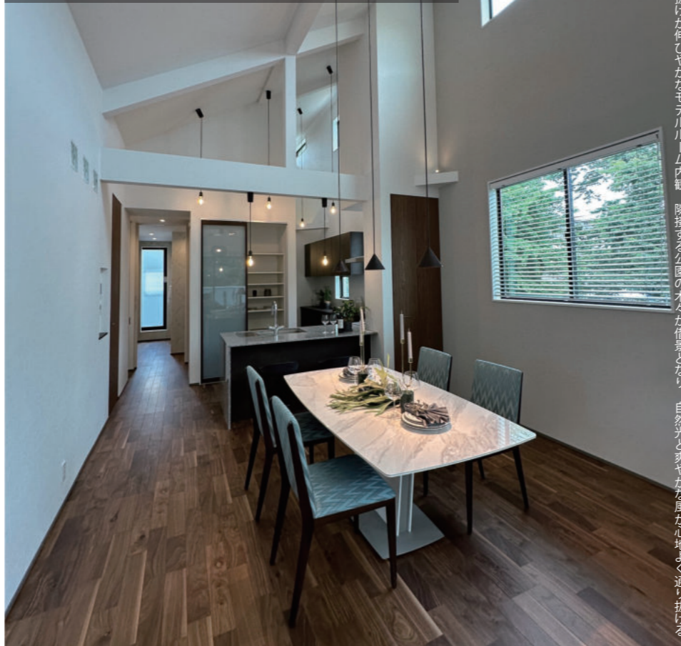
天井高5メートルにもなる吹き抜けが伸びやかなモデルルーム内観。隣接する公園の木々が借景となり、自然光と爽やかな風が心地よく通り抜ける。

諸戸の家は、明治維新の成功者にして日本一の山林王「諸戸清六」の流れをくむ企業が立ち上げた住宅事業のブランド。自社の山林・木材を活かした木造注文住宅を展開していた。のちに住宅事業とともに諸戸の家株式会社に受け継がれ、約半世紀の歴史の中で、累計5,000棟以上の施工・引き渡し実績を誇る。